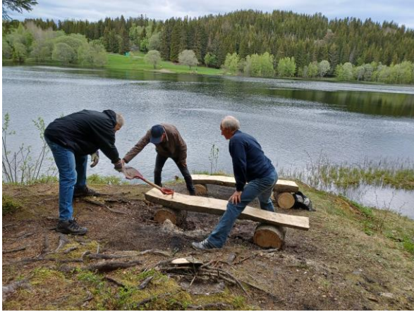
Benk ved Fiskerstien innerst ved Estenstadvannet