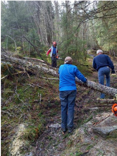
Fjerning av vindfall på sti mot Svarttjønn

Vinteren 21/22 var preget av enkelte kraftige stormer. Vi har i løpet av våren fjernet flere vindfall som har ligget over etablerte stier.