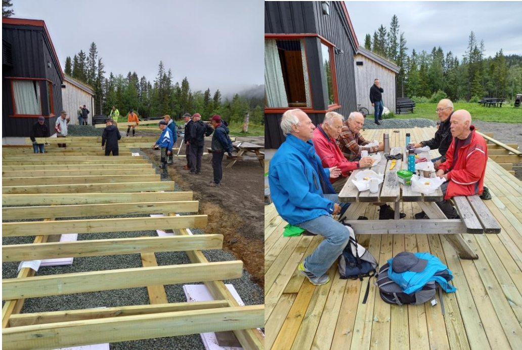
Bygging av platting på hytta