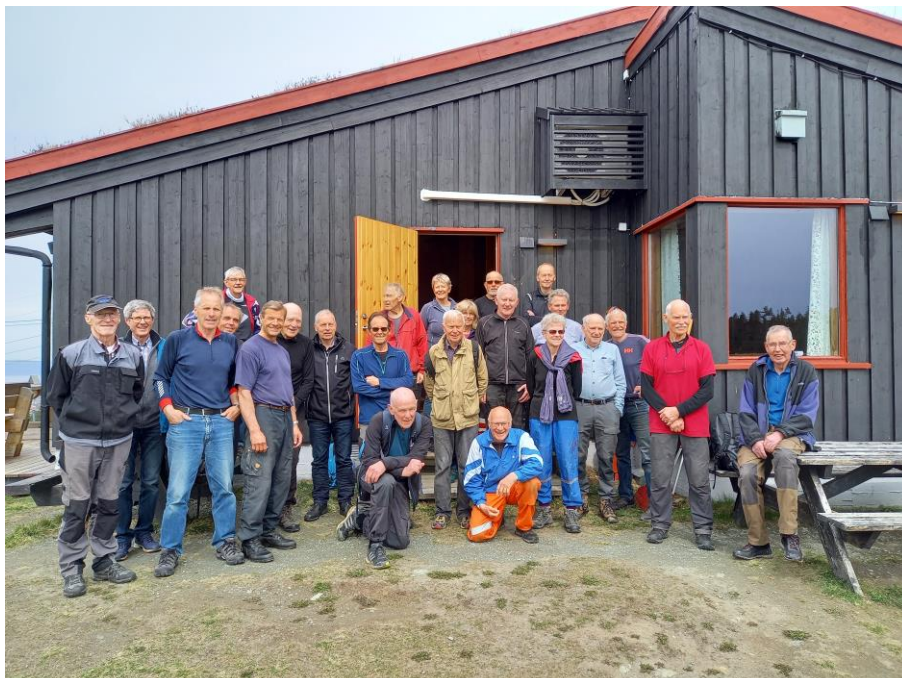
Årets dugnadsgjeng ved samling på Estenstadhytta